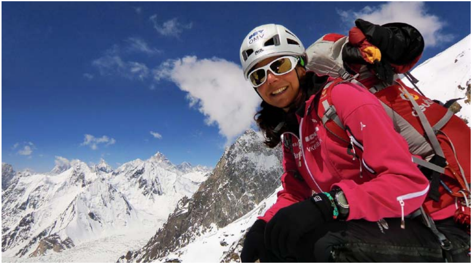
Das Naturfreunde-Mitglied Gerlinde Kaltenbrunner hat alle 14 Achttausender ohne zusätzlichen Sauerstoff bestiegen. Der K2 hat ihre Geduld auf die Probe gestellt: Mehrmals hatte Kaltenbrunner umkehren müssen, bis sie schließlich im August 2012 den Gipfel erreichte.