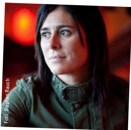
Edurne Pasaban in einem Café in Barcelona vor dem Aufbruch nach Asien, wo sie die Annapurna und den Shisha Pangma besteigen wollte